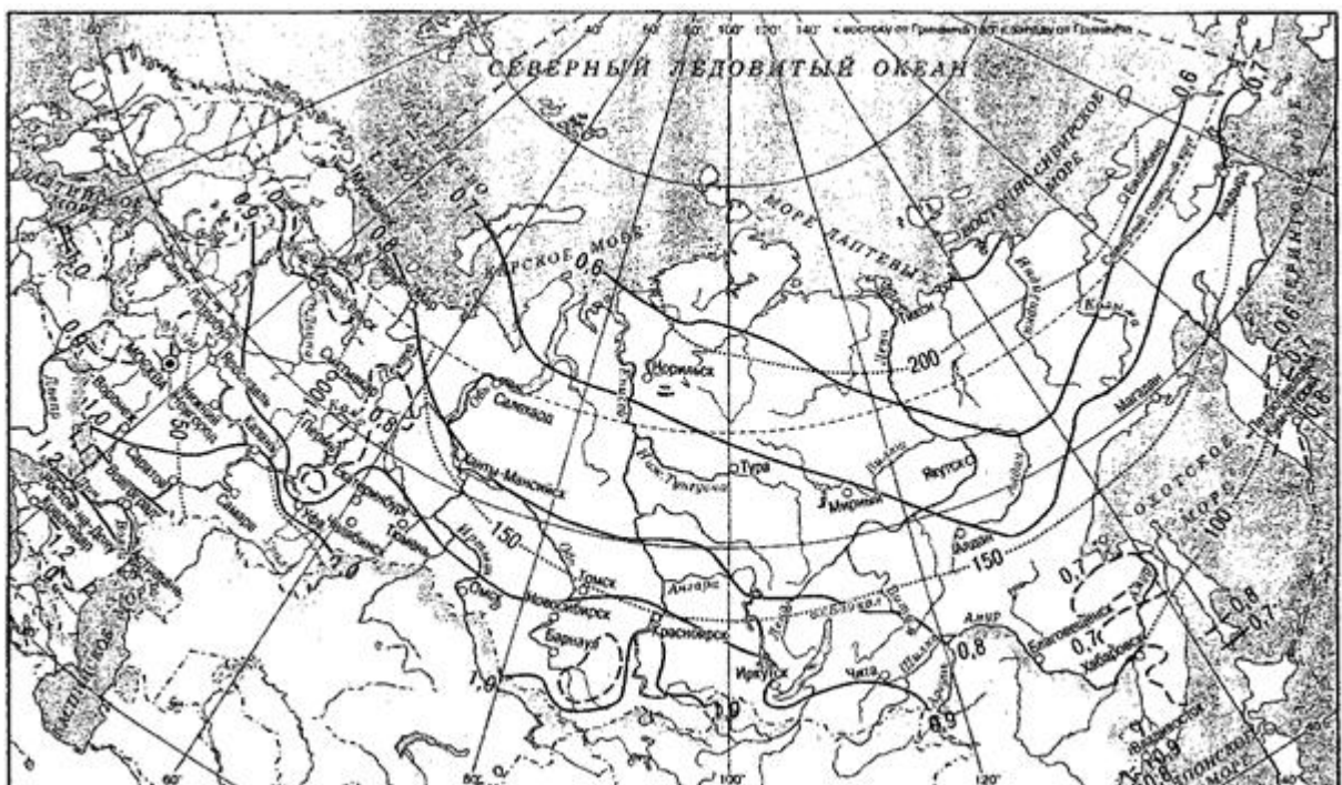
Рисунок 1 - Климатические коэффициенты для определения величины нагрузки на иловые площадки (сплошные и пунктирные линии) и продолжительности периода намораживания на иловых площадках, дни (точечные линии)

9.2.14.39 Площадь иловых площадок следует проверять на намораживание. Продолжительность периода намораживания следует принимать равной числу дней со среднесуточной температурой воздуха ниже минус 10 °С. Количество намороженного